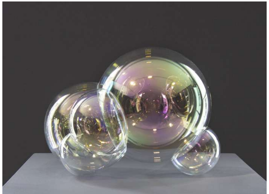
Hideki Yoshimoto Rise